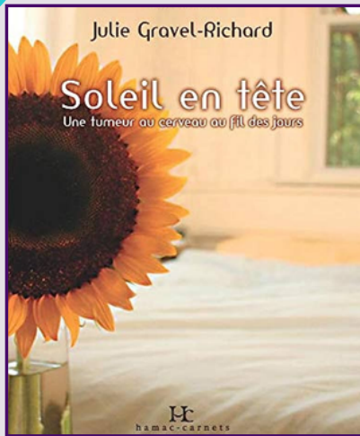
Soleil en tête : une tumeur au cerveau au fil des jours (2012) Julie Gravel-Richard