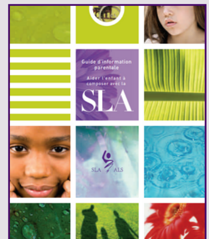
Guide d'information parentale: Aider l'enfant à composer avec la SLA (2007) Société canadienne de la SLA

Disponibles pour emprunter dans la salle 354