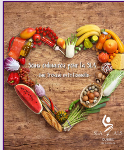
Soins culinaires pour la SLA (2021) Société de la SLA du Québec Available in English