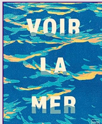
Voir la mer (2019) Ruth Fitzmaurice