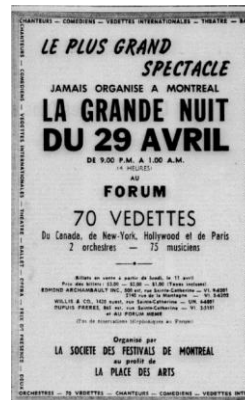
Publicité pour La Grande Nuit du 29 avril, Le Devoir , 9 avril 1960, p. 10

Dans l'objectif de faciliter les échanges d'idées entre chercheur·e·s en études urbaines, le CRIEM a mis en place un blogue sur la plateforme Medium . Celui-ci servira d'espace de discussion interdisciplinaire pour les membres. On y formulera des questions, des hypothèses, des réflexions. Montréal y sera observée sous tous les angles disciplinaires et nos chercheur·e·s feront du blogue un terrain de jeu pour lancer des idées. Les trois premiers billets traitent de la Grande Nuit du 29 avril 1960 ( Will Straw ), de la bande dessinée montréalaise vue depuis l'Italie ( Anna Giaufret ) ainsi que de Griffintown et ses fantômes ( Pascal Brissette ).