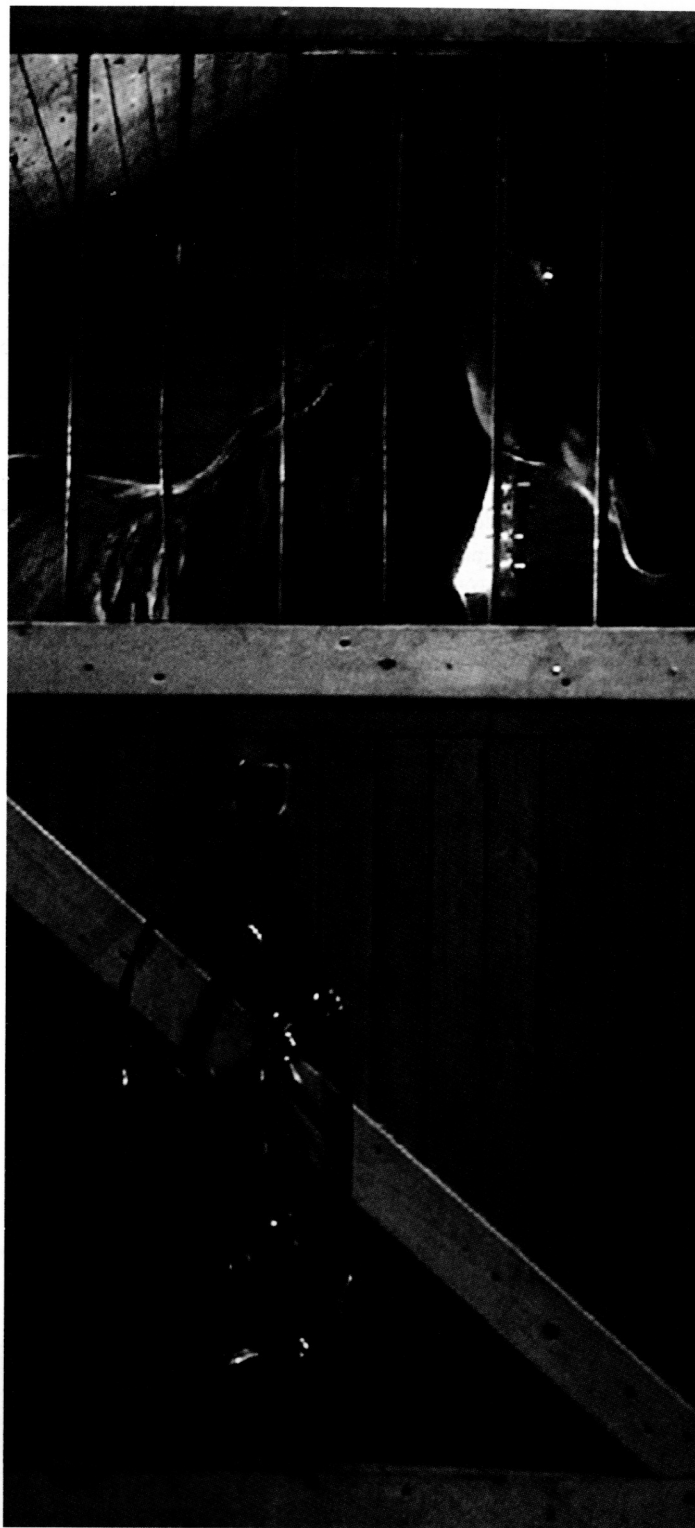
BOX (2009) d'Olivia Boudreau, séquence HD, 22 heures.

intervalle », entre deux technologies de l'image-son – l'image filmique et l'image numérique – auxquelles nous pourrions ajouter une troisième : l'image photographique. 11